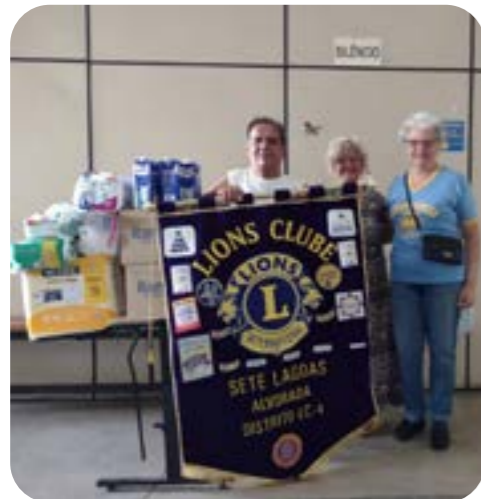
LC SETE LAGOAS ALVORADA

“Mãos que servem, são tão santas quanto aos lábios que rezam”