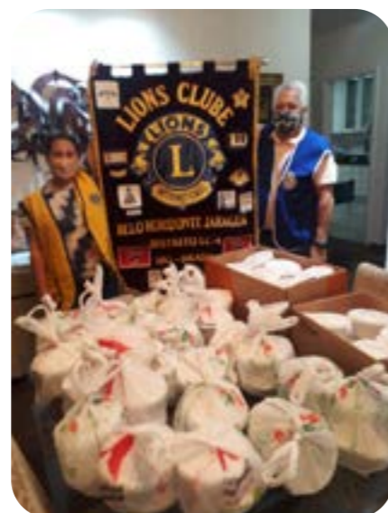
LC BH JARAGUÁ