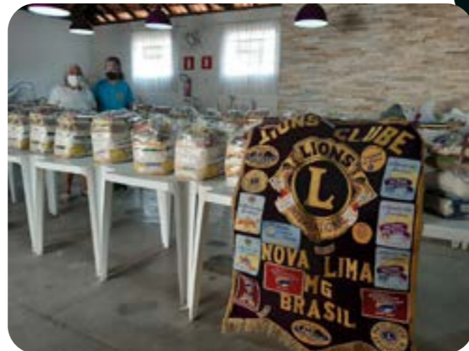
LC NOVA LIMA