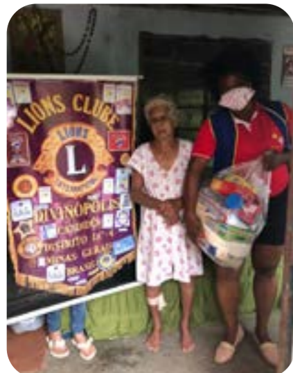
LC DIVINÓPOLIS CANDIDÉS