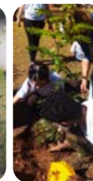
LC LAGOA SANTA