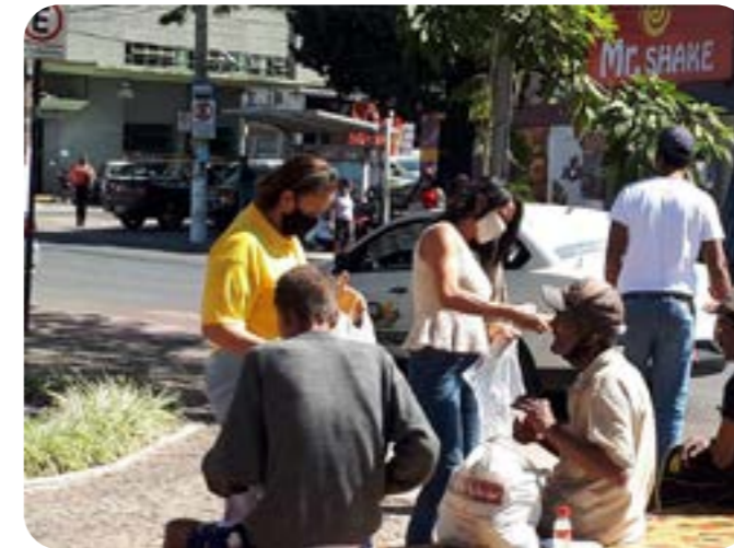
LC LAGOA SANTA