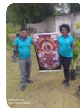
LC DIVINÓPOLIS CANDIDÊS