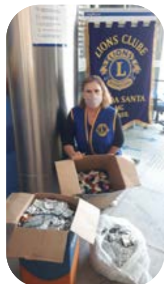
LC LAGOA SANTA