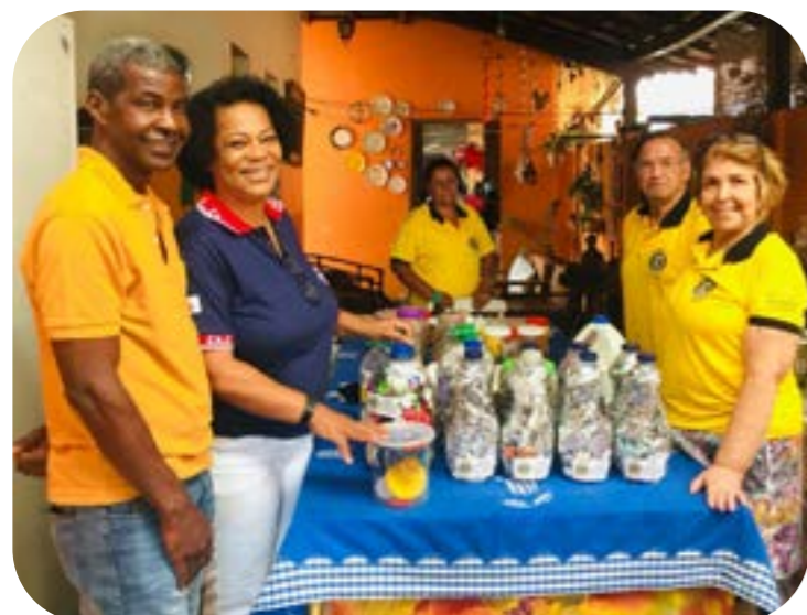
LLCC TRÊS MARIAS E CORINTO