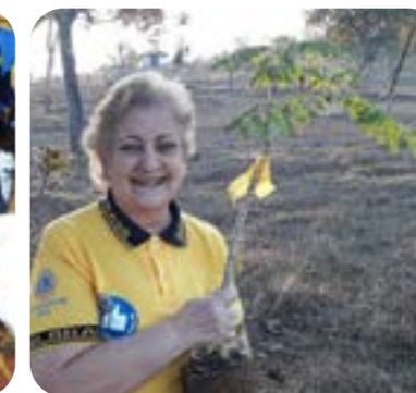
LC TRÊS MARIAS