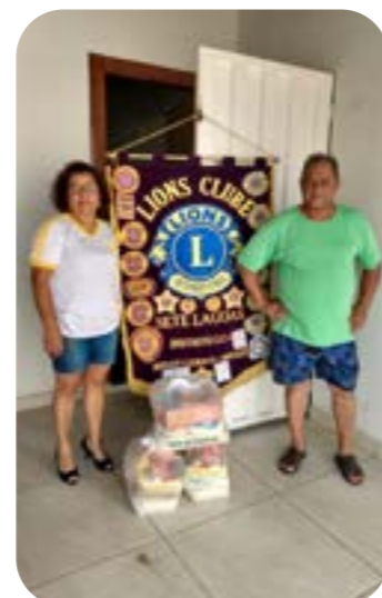
LC SETE LAGOAS