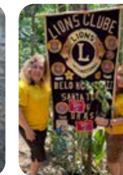
LC SANTA TERESA

Vamos plantar árvore e cuidar dos nossos rios?