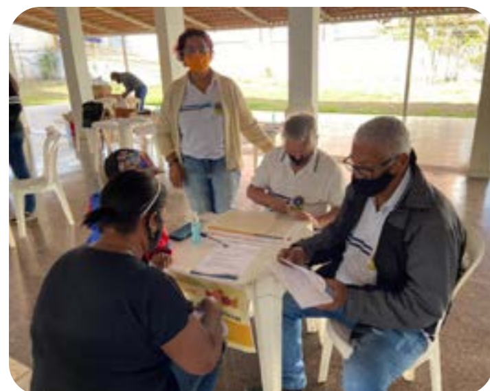
LC TRÊS MARIAS