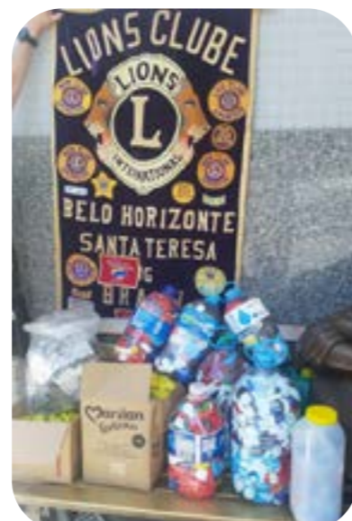
LC SANTA TERESA