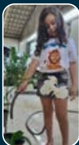
LC Três Marias

Com autenticidade e muito empenho, os leõezinhos do Distrito LC 4 visitaram rios, criaram poemas, produziram arte e mostraram a utilidade da água.