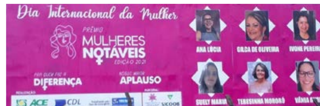
LC Três Marias