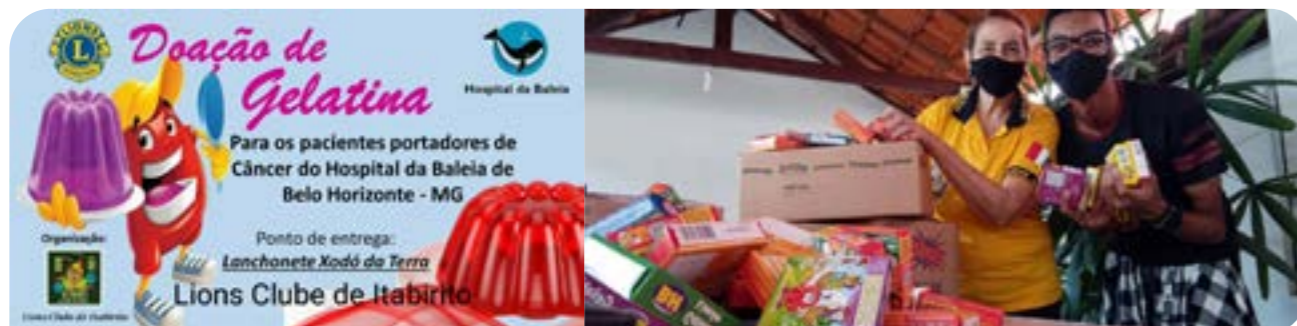
LC Vespasiano e LEO Clube Potência