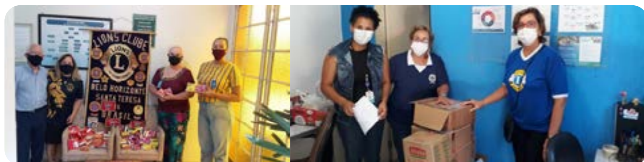
LC BH Santa Teresa e LEO Clube Pioneiro