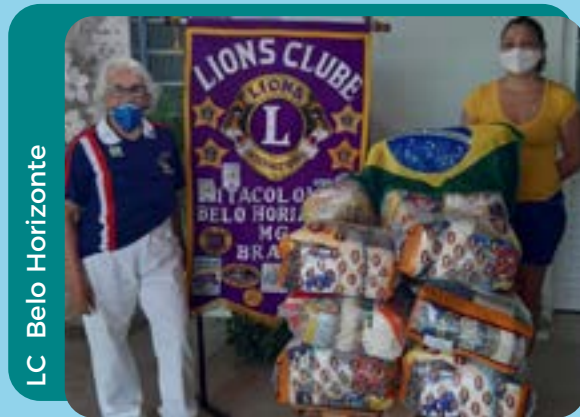
LC Belo Horizonte

Nós servimos para minimizar a fome e contribuir com o acesso de alimentos nutritivos aos menos favorecidos.