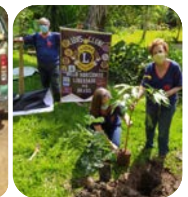
LC BH LIBERDADE

Clubes que estão fazendo parte do reflorestamento no Sítio Bela Vista, na Cidade de Simonévia: