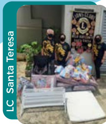
LC Santa Teresa