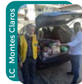
LC Montes Claros