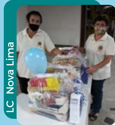
LC Nova Lima