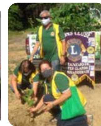
LC MONTES CLAROS