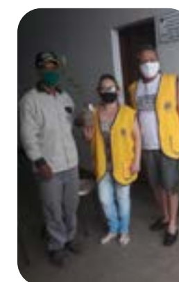
LC TRÊS MARIAS