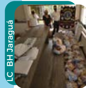
LC BH Jaraguá