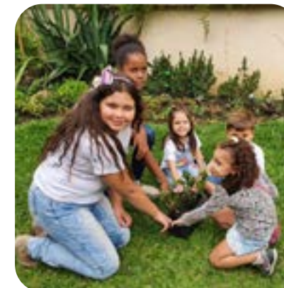
LEÕEZINHOS DO LC JARAGUÁ