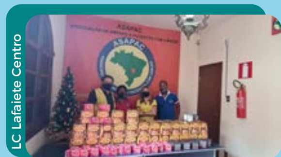
LC Lafaiete Centro