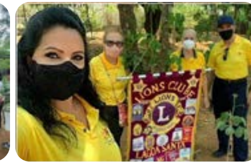
LC LAGOA SANTA